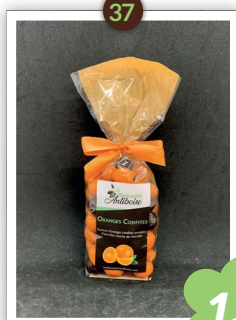
Oranges confites Chocolatés 250g