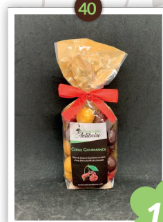
Amour de cerise Chocolatés 235g