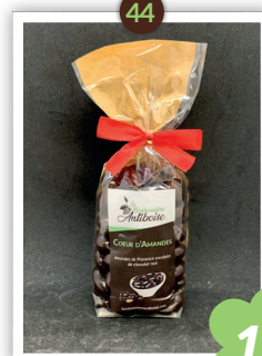
Coeur d'Amandes Chocolatés 250g Uniquement en noir