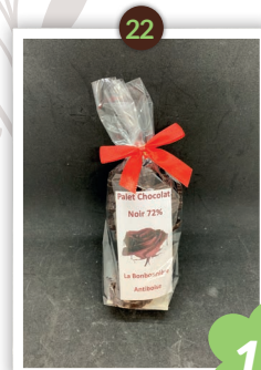
24 carrés chocolat Noir Disponible en noir uniquement