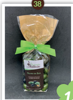
Olives du Sud Chocolatés 250g