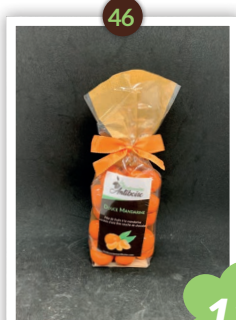
Douce Mandarine Chocolatés 235g