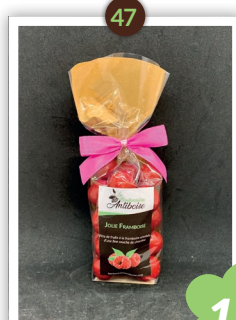
Jolie Framboise Chocolatés 235g