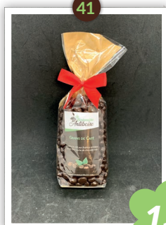
Grains de café Chocolatés 250g