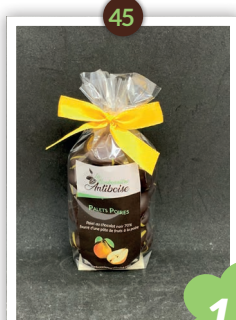
Palet Poire Chocolatés 205g