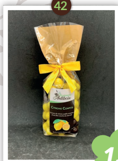
Citrons confits Chocolatés 250g