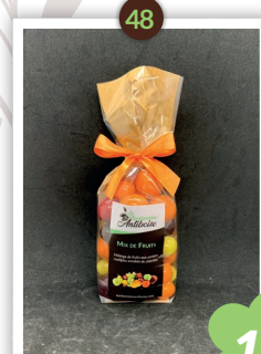
Mix de Fruits Chocolatés 240g