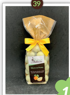
Délice de Poires Chocolatés 235g