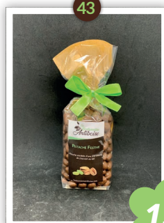
Pistache festive Chocolatés 230g Uniquement en lait