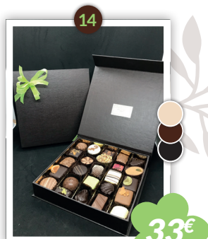
Luxe 1 étage Grand modèle 550g - 18cm Mixte noir, lait & blanc