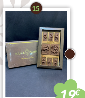
Boîte adulte 29x18cm Disponible en lait uniquement