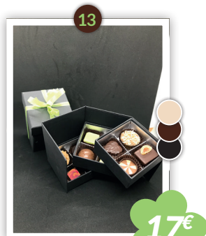
Luxe 3 étages 315g Mixte noir, lait & blanc