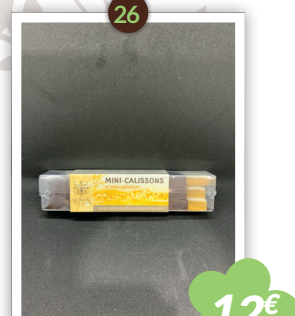
Mini-Calissons & Mini-Calinoises 140g