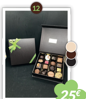
Luxe 1 étage Petit modèle 365g - 15cm Mixte noir, lait & blanc